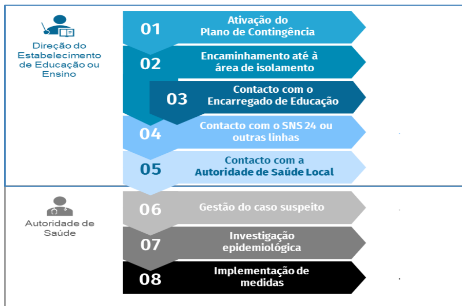
Figura 1. Fluxograma de atuação perante um caso suspeito de COVID-19 em contexto escolar (Retirado de Referencial para as Escolas. DGS-2020)

Perante a identificação de um caso suspeito, devem ser tomados os seguintes passos: